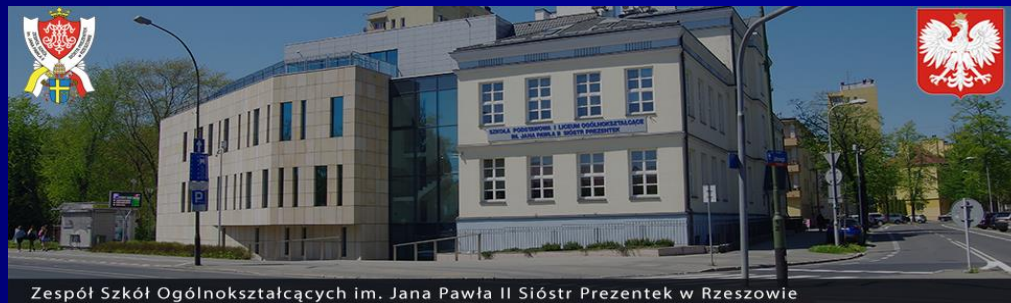
Zespół Szkół Ogólnokształcących im. Jana Pawła II Sióstr Prezentek w Rzeszowie