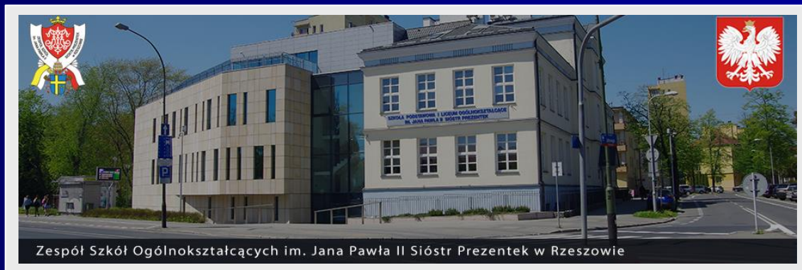
Zespół Szkół Ogólnokształcących im. Jana Pawła II Sióstr Prezentelek w Rzeszowie