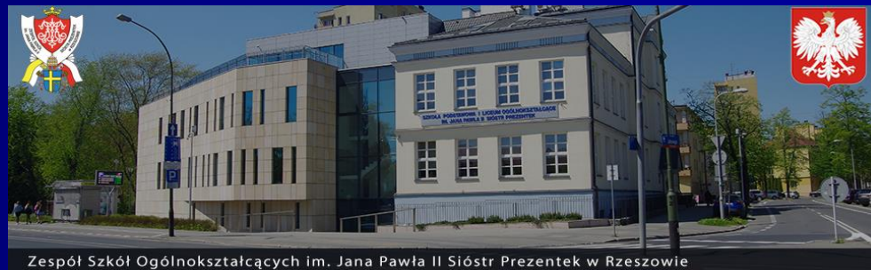
Zespół Szkół Ogólnokształcących im. Jana Pawła II Sióstr Prezentek w Rzeszowie