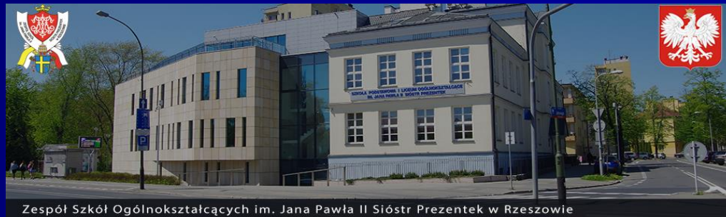
Zespół Szkół Ogólnokształcących im. Jana Pawła II Sióstr Prezentek w Rzeszowie